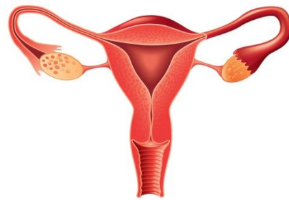
ระบบสืบพันธุ์เพศหญิง

รังไข่มีรูปร่างคล้าย เม็ดมะม่วงหิมพานต์ (เมล็ดถั่ว)